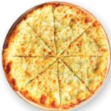
Խաչապուրի սպանախով պանրի տեսականի, սպանախ, կարագ Хачапури со шпинатом сырное ассорти, шпинат, масло