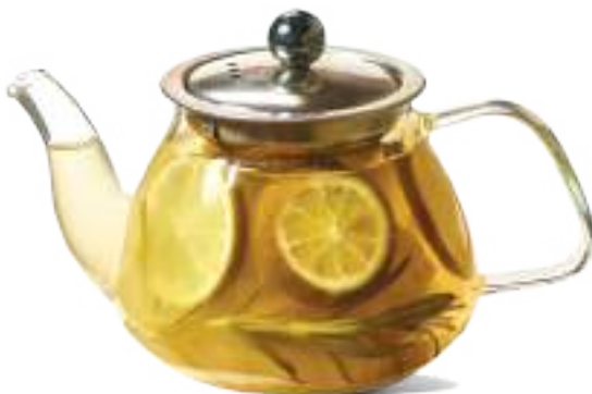
Չոճապղպեղի թեյ 0.5 լ / 1 լ Имбирный чай 0.5 л / 1 л 1500/2500