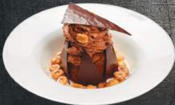
Շերեփ Шереп 3200