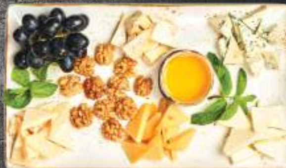
Պանրի տեսականի գինու համար հոլանդական (Հին Ամստերդամ), ռոքֆոր, պարմեզան, մոցարելլա, բրի (Կաստելլո)

Сырная тарелка к вину голландский (Старый Амстердам), рокфор, пармезан, моцарелла, бри (Кастелло)