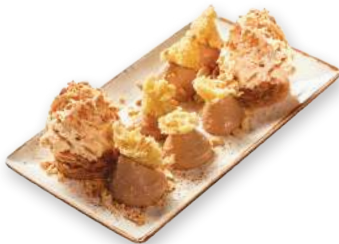
«Սնիկերս» ֆիրմային Фирменный «Сникерс» 3300