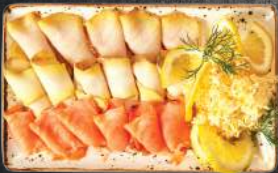
Ձկան տեսականի սաղմոն, թառափ, յուղածուկ

Рыбное ассорти лосось, осетр, масляная рыба