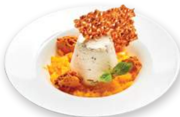
Կասատա անուշեղենով Касата с орехами и сухофруктами 2900