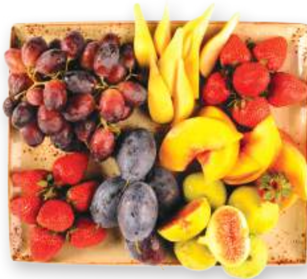
Ամառային մրգի տեսականի Ассорти из летних фруктов 6500