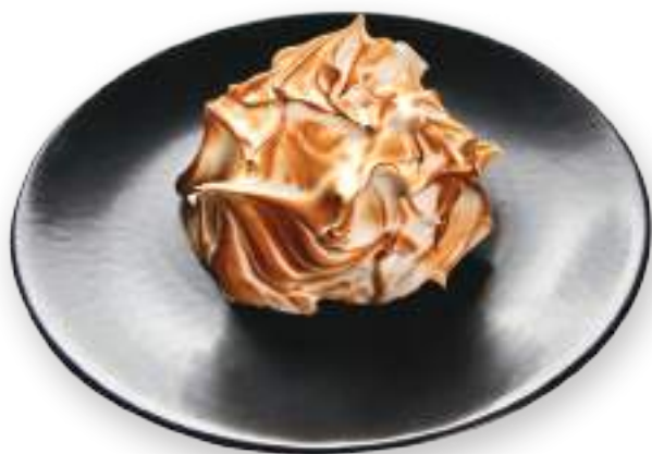
Դելիս ազնվամորիով Делис с малиной 2400