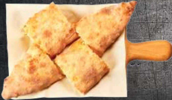
Թոնրի խաչապուրի պանրի տեսականի, համեմունք Хачапури в тандыре сырное ассорти, специи