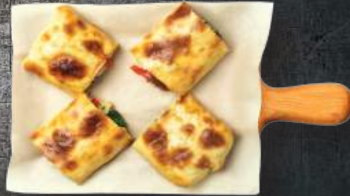
Գյուղական խաչապուրի պանրի տեսականի, լոլիկ, կանաչի Хачапури по-деревенски сырное ассорти, помидор, зелень