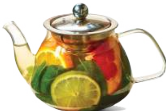
Ցիտրուսային թեյ 0.5 լ / 1 լ Цитрусовый чай 0.5 л / 1 л 1500/2500