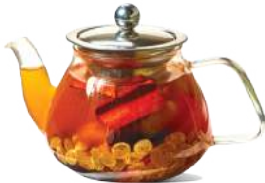
Աշնանային նոկտյուրն 0.5 լ / 1 լ Осенний ноктюрн 0.5 л / 1 л 1800/2700