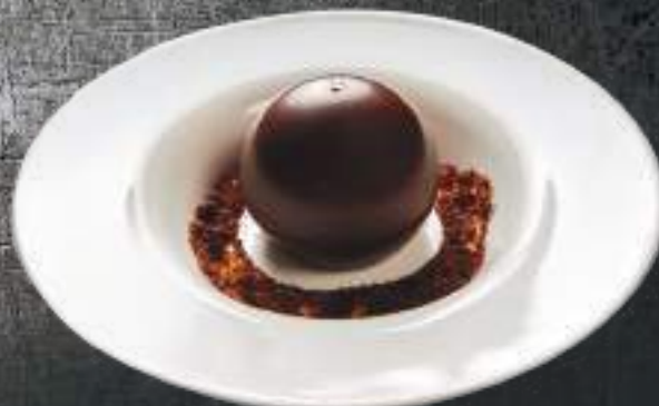
Շոկոհոլիկ Шокоголик 3200