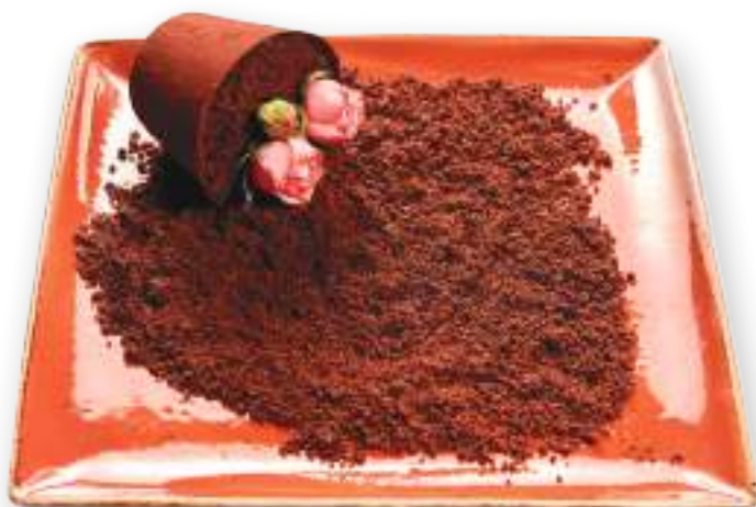
Վոտրված ծաղկաման Разбитый горшочек 3500