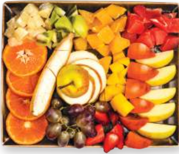
Մրգի տեսականի Фруктовое ассорти 8000