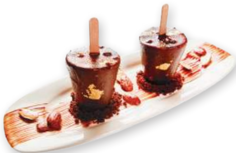
Եսկիմո Эскимо 4200