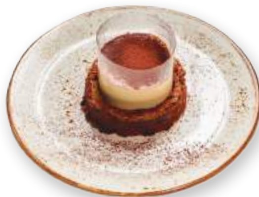
Շոկոլադ վանիլա Шоколад ванилла 3300