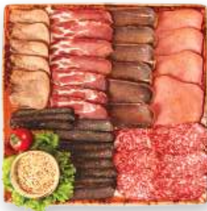
Մսի տեսականի «Ֆիրմային» բաստուրմա, սուջուկ, տավարի լեզու, երշիկ, տավարի ֆիլե, բեկոն

Фирменное мясное ассорти бастурма, суджук, говяжий язык, колбаса, говяжье филе, бекон